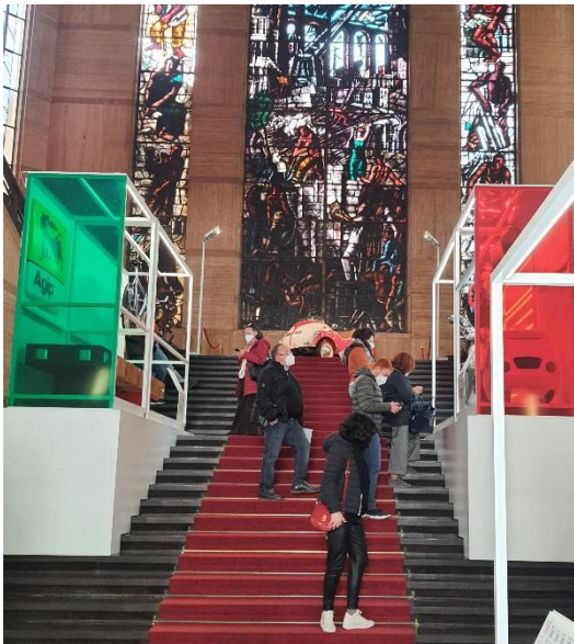
Mostra Italia Geniale al MISE

promozionali realizzato dalla rete nel mondo delle Ambasciate, dei Consolati, degli Istituti Italiani di Cultura e dell'Agenzia ICE. Il tema scelto per quest'anno dal Ministero e dagli altri partner sottolinea la valenza della sostenibilità , che sia l'Italia che la Slovenia considerano un elemento chiave per lo sviluppo del XXI secolo.