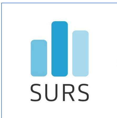
Logo: Twitter @StatSlovenia