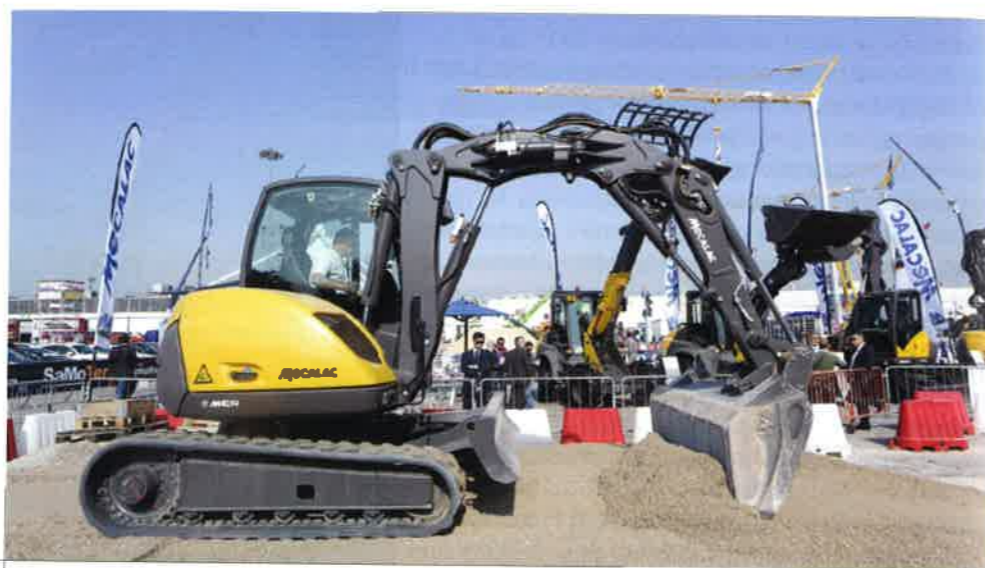
U talijanskoj gradu Veroni od 22. do 27. veljače održat će se 30. sajam građevne mehanizacije i opreme SaMoTer 2017. Radi se o najvećem sajmu takve vrste u Europi

SaMoTer, trienalni međunarodni sajam građevne mehanizacije, održava se od 1964. i najvažnije je događanje takve vrste u Italiji. Na njemu se predstavlja građevna mehanizacija svih vrsta. Sajam je ujedno najvažnija orijentacijska točka za industriju